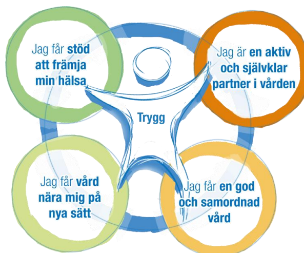
Figur 1: Målbild Hälsa och vård år 2035

Målbild hälsa och vård år 2035 beskriver ett paradigmskifte för vården ur ett medborgarperspektiv. Målbilden ska ge kraft att förändra arbetsätt och skapa nya tjänster som formar en ny vård. En vård som svarar mot varje persons behov och förutsättningar och möjliggör en jämlik hälsa hos befolkningen. De nya arbetsätten ska också underlätta kompetensförsörjningen och bidra till en hälsofrämjande arbetsmiljö.