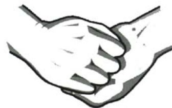
4. Omslut fingrarna med motsatta handens fingrar och gnid mot handflatan.