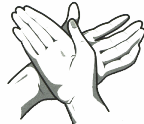
2. Höger hand mot vänster handrygg och tvärtom.