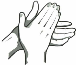
1. Handflatorna mot varandra

Tvätta med riklig mängd tvål. Gnid händerna fram och tillbaka och upprepa varje rörelse fem gånger. Glöm inte handlederna. Följ schemat (efter Ayliffe):