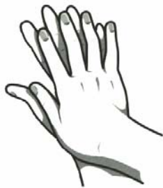
3. Fläta fingrarna med handflatorna mot varandra.