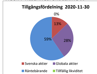
FIGUR 7 TILLGÅNGSFÖRDELNING %