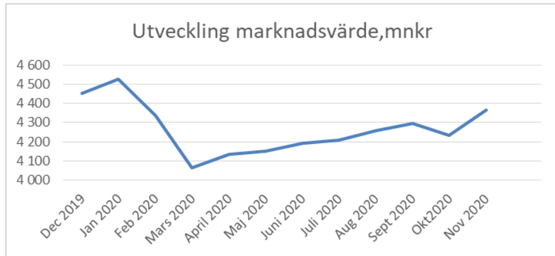
FIGUR 8 UTVECKLING AV PENSIONSPORTFÖLJENS MARKNADSVÄRDE SEDAN DEC 2019

Till följd av den kraftiga börsturbulensen under februari-mars gjordes en nedviktning av aktieandelen i regionens portfölj från 53 procent till 15 procent. Nedviktningen gjordes för att skydda värdet på portföljen som inte får understiga 85 procent av det högsta värdet de senaste 24 månaderna vilket är den risknivå som regionen beslutat i Finanspolicyn. Skyddsvärdet utgör per november 3 845 mnkr. I juni påbörjades uppviktning av andelen aktiefonder som per november är 40 procent.