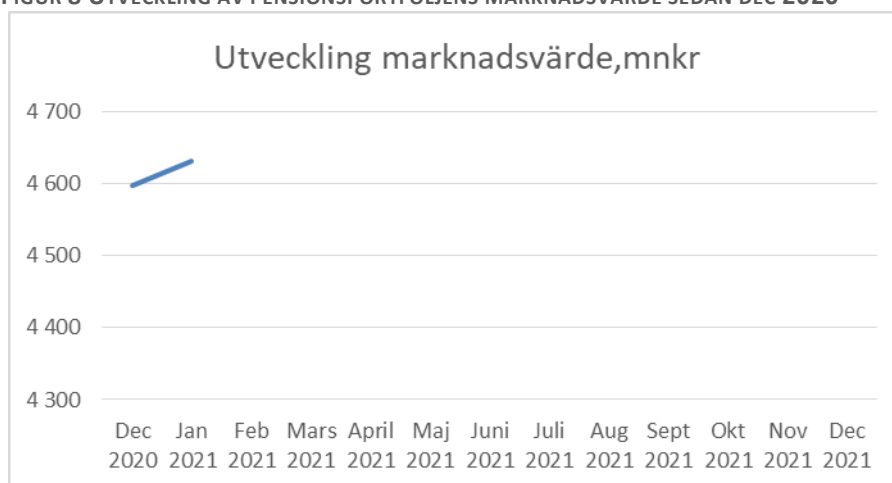
FIGUR 8 UTVECKLING AV PENSIONSPORFÖLJENS MARKNADSVÄRDE SEDAN DEC 2020

Pensionsportföljens marknadsvärde är 4 632 mnkr per sista januari, vilket är 34 mnkr högre än vid årsskiftet. Regionen har per januari ett orealiserat värde i portföljen på 307 mnkr. Portföljen består av 44 procent aktiefonder och 56 procent räntebärande placeringar. Avkastningen hittills i år är 0,7 procent. Portföljen motsvarar 60 procent av pensionsförpliktelserna.