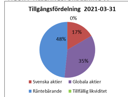
FIGUR 7 TILLGÅNGSFÖRDELNING %

Pensionsportföljens marknadsvärde den sista mars är 4 820 mnkr, vilket är 222 mnkr högre än vid årsskiftet. Regionen har ett orealiserat värde i portföljen på 493 mnkr. Portföljen består av 52 procent aktiefonder och 48 procent räntebärande placeringar. Avkastningen hittills i år är 4,8 procent. Portföljen motsvarar 63 procent av pensionsförpliktelserna.