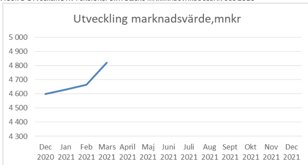
FIGUR 8 UTVECKLING AV PENSIONSPORTFÖLJENS MARKNADSVÄRDE SEDAN DEC 2020

Pensionsportföljens marknadsvärde den sista mars är 4 820 mnkr, vilket är 222 mnkr högre än vid årsskiftet. Regionen har ett orealiserat värde i portföljen på 493 mnkr. Portföljen består av 52 procent aktiefonder och 48 procent räntebärande placeringar. Avkastningen hittills i år är 4,8 procent. Portföljen motsvarar 63 procent av pensionsförpliktelserna.